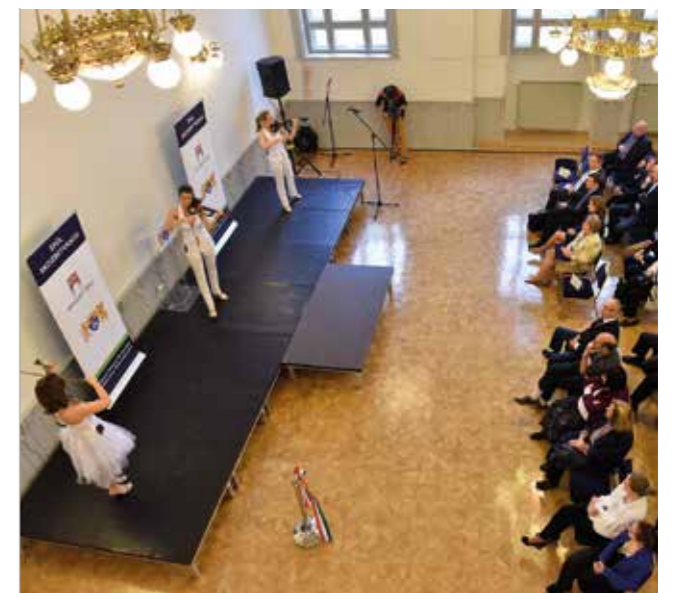
A vendégek a népszerű Princess hegedűtrió műsorát hallgathatták meg

A beszédek követően a polgármester és az intézmény vezetője átvágták a nemzeti színű szalagot, mellyel hivatalosan is átadták a megújult ERÖMŰVHÁZ épületét a közönségnek. A rendezvényt a népszerű Princess hegedűtrió koncertje zárta, akik a komoly és a könnyűzene ötvözetével hozták el a klasszikus zeneirodalom legszebb dallamait a megújult intézmény falai közé. A zenekar tagjainak színvonalas, modern előadása méltó módon képviselte az erzsébetvárosi művelődési ház új időszámításának kezdetét.