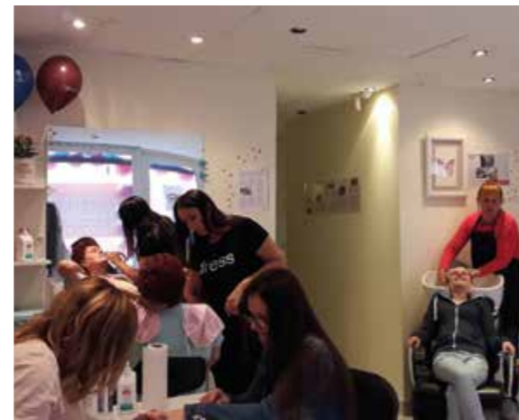
Erzsébetváros 2016. május 26.

Azok az érdeklődők, akik a felsoroltak közül igénybe vették valamelyik szolgáltatást, a ruhabörzén kiválaszhattak három – nekik tetsző – ruhadarabot a korábban felajánlott adományok közül. A jövőben negyedévente szeretnének hasonló nyílt napokat szervezni.